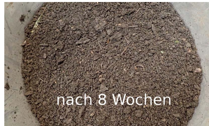
Nach nur 8 Wochen Kompostierung bei 28°C